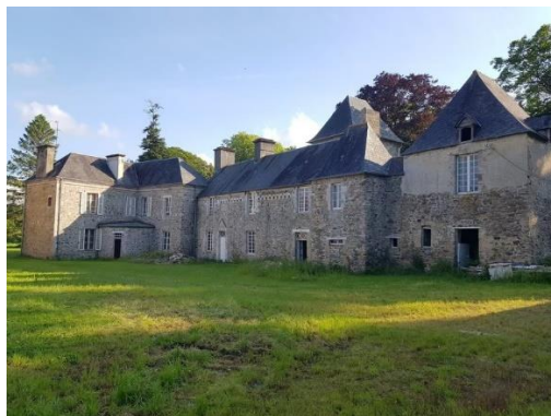
Manoir du Bois, Feugères