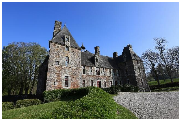
Château - Cerisy-la-Salle

17 propriétaires privés ouvrent de manière exceptionnelle, comme les manoirs de Feugères, Dragey-Ronthon, ou encore le domaine de Beaupaire à Martinvast. En s'inscrivant à Pierres en lumières, les propriétaires qui assument avec passion une charge patrimoniale souvent lourde, ont tous souhaité partager avec les habitants, l'histoire de leur patrimoine et leur engagement à le sauvegarder et le transmettre. Cette ouverture des Monuments historiques constitue aussi l'un des critères de bonification de l'aide financière du Département pour la restauration des édifices.