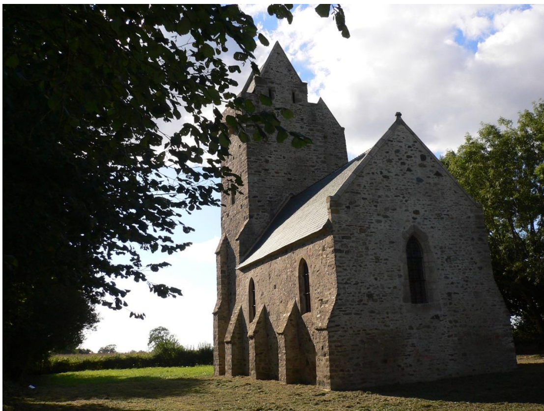
Ermitage Saint-Gerbold - Gratot

À l'ermitage Saint-Gerbold à Gratot, il sera proposé au visiteur de se laisser porter au son de la voix du conteur permettant ainsi de découvrir de manière originale, un des rares ermitages encore existant en France.