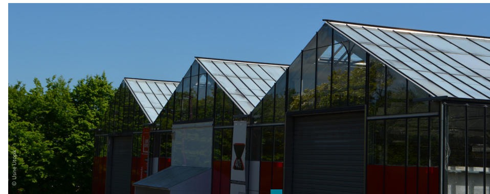
La façade de l'Usine Utopik à Tessy-Bocage

Un soutien à un artiste plasticien : ses travaux de résidence aux Fours à Chaux pourraient devenir une exposition dans la Galerie de l'Usine Utopik pour concrétiser sa démarche et présenter ses recherches au public.