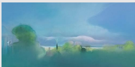
(Bonjour monsieur Millet) paysages contemporains de Valérie Boyce (du 5 avril au 2 nov. 2025)

L'artiste-plasticienne normande Valérie Boyce est peintre de paysage et défend ce genre pictural comme partie prenante d'une expression très contemporaine de l'art aujourd'hui. Elle propose ici une exposition personnelle sur la Normandie, celle de Millet, disparu il y a 150 ans, mais aussi celle qu'elle ressent, observe et conçoit aujourd'hui comme artiste contemporaine.