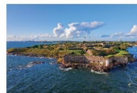
Forteresse de Suomenlinna Finlande - XVIII e siècle

Cette exposition a été réalisée par la Maison de l'Homme et de la forêt (Jupilles, 72). Elle s'intéresse aux forêts sous les règnes de Louis XIV et de Louis XVI, à la recherche des arbres dédiés à la construction navale, depuis leur transport jusqu'aux activités réalisées dans l'arsenal.