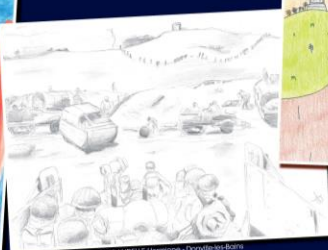
GUSTON BÉLLE Héloïse - Dorville-et-Bains