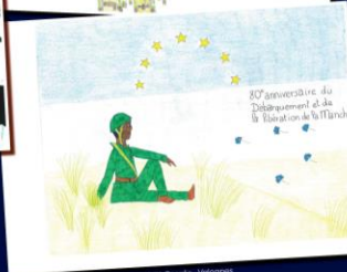
DUVAL Bastien - Volanges