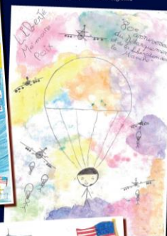
MADÉLINE Chavrier - Negreville