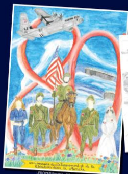
LEBON Emma - Magnville