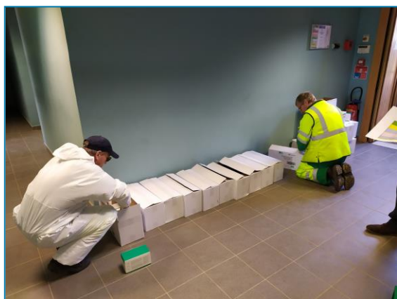
Le matériel prévu à la livraison par le Centre d'Entretien Routier de Saint-Lô.

Dans le but de soulager le personnel de santé les Groupements Hospitaliers de Territoires (GHT) ont été destinataires de matériels, principalement des masques, via l'ARS : le Département de la Manche a proposé à cette dernière d'en assurer la distribution partout sur le territoire afin que l'ARS puisse se concentrer sur son cœur de métier, d'éviter aux établissements de se déplacer et ainsi diminuer les délais d'acheminement.