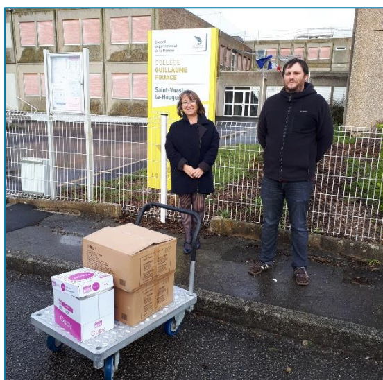
Ici, matériel collecté au collège Guillaume Fouace de Saint-Vaast-la-Hougue

Au total, ce sont 80 000 paires de gants, 20 000 charlottes, 6 000 sur chaussures, 2 000 masques, 3 500 « kits visiteurs » (ensemble composé de blouse, charlotte, masque et sur chaussures) et 100 litres de gel hydro alcoolique qui ont été rassemblés. Les collèges privés se sont eux aussi fortement mobilisés.