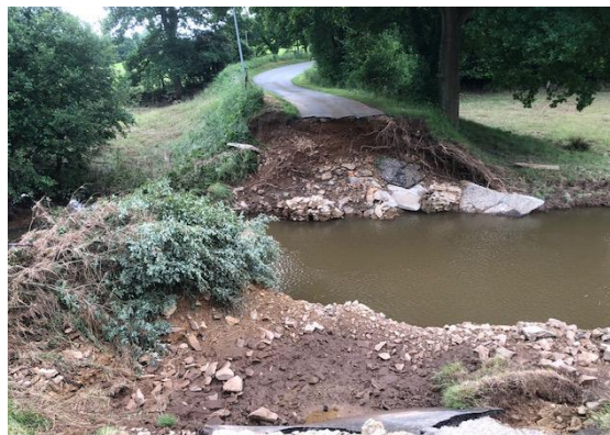
RD358 entre Savigny le Vieux et Landivy (53)