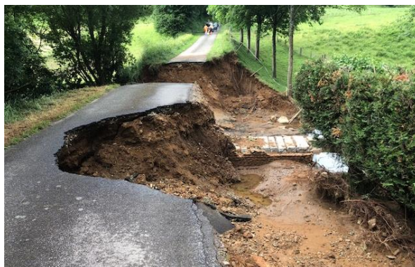
RD588 Le moulin de Buais , entre Buais et Fougerolles du Plessis (53)