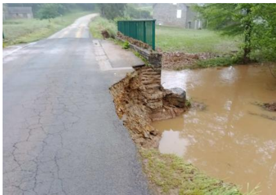
RD 158 vers Landivy (53)