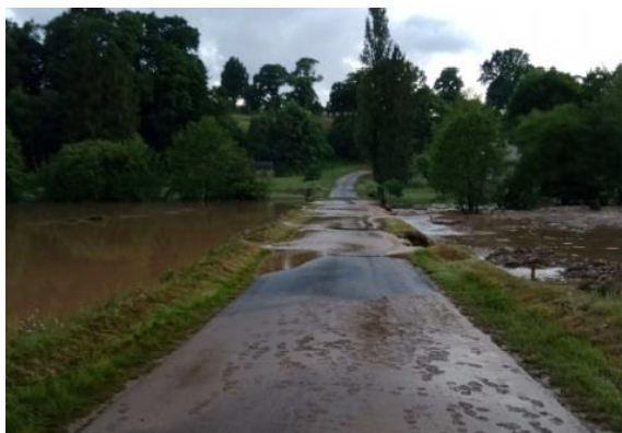
RD277 – Chevry - Direction Moyon

Compte tenu de l'importance des dégradations, les routes barrées le sont pour une durée indéterminée à ce jour. La reconstruction des ouvrages d'art des routes départementales 358 et 588 sont en cours de chiffrage, mais nécessiteront plusieurs mois. S'agissant d'axes du réseau local, aucune déviation n'est mise en place.