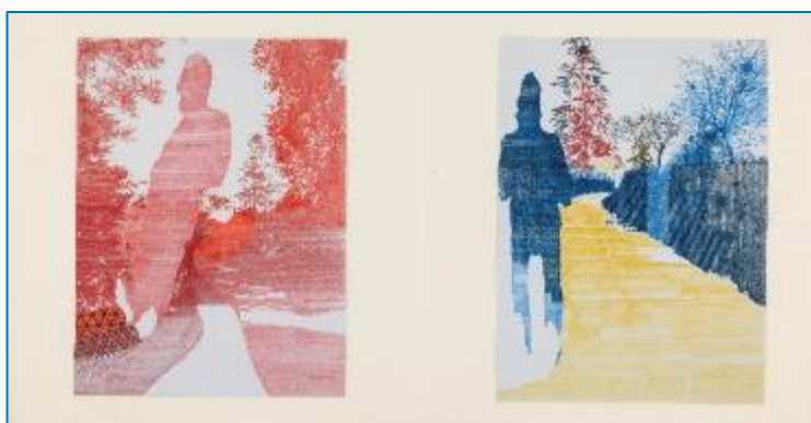
Animal à deux pattes sans plume, Retour à la case départ, le chemin. Ombre d'Alain Badiou et ombre de Matieu, crayon sur papier.

Cette exposition est conçue avec le souhait de proposer quelques portes d'entrée sur l'univers passionnant de cet artiste. Elle comprend également un espace de manipulation centré sur la construction des zelliges et un livret-jeu pour les plus jeunes. Plusieurs ouvrages de matieu sont disponibles à la boutique du site.