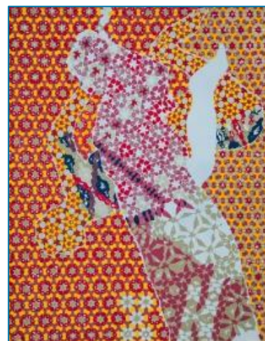
Animal à deux pattes sans plume, ombre de Sophie Leys, huile sur toile.

En 2021, l'équipe de l'abbaye de Hambye a conçu l'exposition « Maurice Matieu, l'ombre et la forme », autour de l'œuvre de cet artiste d'envergure internationale, dont l'atelier était installé tout près, à Saint-Denis-le-Gast. Le succès de cette exposition auprès du public et l'intérêt suscité par les œuvres de ce peintre encore trop peu connu nous a incité à reconduire l'accrochage pour sa deuxième saison consécutive en 2022.