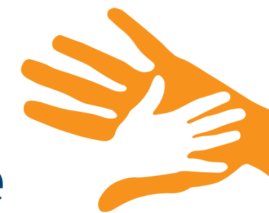
Schéma départemental d'accueil des gens du voyage de la Manche DOCUMENT DE SYNTHÈSE