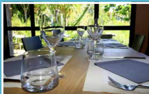
Restaurant Le Carré

Profitez du restaurant « Le Carré » pour vous restaurer au milieu d'une végétation luxuriante.