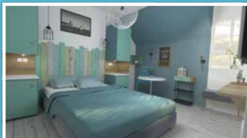
Hôtel 26 chambres

En groupe ou en individuel, offrez-vous un séjour à l'écart du monde dans des bâtiments chargés d'histoire.