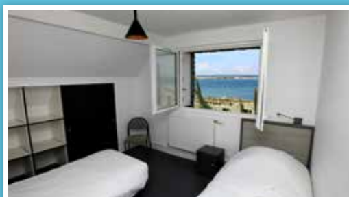
Hostel (auberge de jeunesse) 18 chambres

Profitez du restaurant « Le Carré » pour vous restaurer au milieu d'une végétation luxuriante.