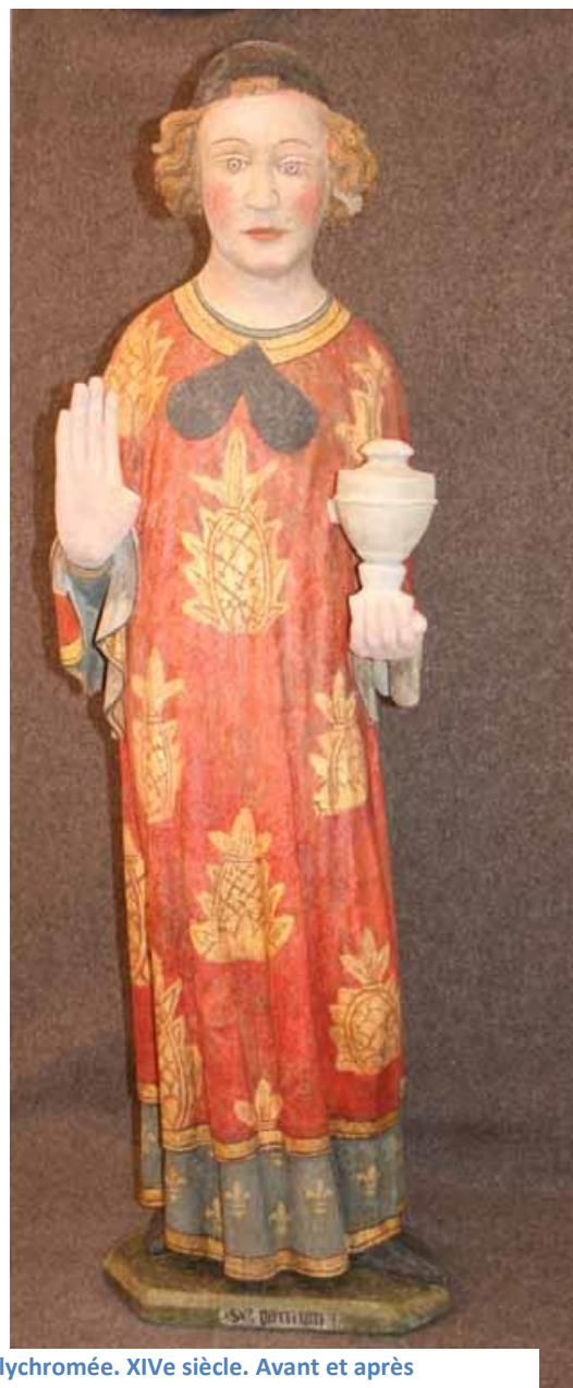
Figure 6. Statue de saint Damien, église de Subligny, pierre calcaire polychromée. XIVe siècle. Avant et après restauration.