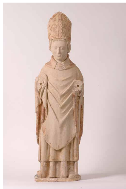
Figure 1. Statue de saint Gerbold, pierre calcaire, Xe siècle. Collection départementale.