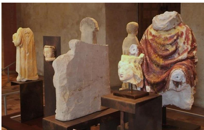
Figure 5. Vue de l'exposition Fragments d'histoire © Conseil départemental de la Manche/CAOA.

L'exposition « Fragments d'histoire » sur le site de l'abbaye de Hambye, est l'occasion de valoriser cette collection en majorité médiévale.