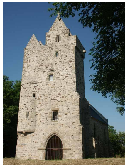
Figure 4. Ermitage saint Gerbold à Gratot. Propriété du Conseil départemental de la Manche.

La statue du saint évêque de Bayeux, qui guide le visiteur dans l'exposition, fut découverte lors des travaux de l'ermitage Saint-Gerbold à Gratot en 2002. Le bâtiment est une ancienne chapelle qui appartenait aux seigneurs de Gratot. Lieu insolite, il est propriété départementale depuis 10 ans. La sculpture qui était enterrée sous le dallage, fut retrouvée en plusieurs morceaux. Elle est aujourd'hui restaurée.