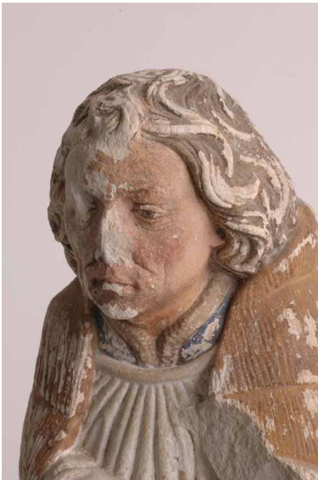
Figure 2. Statuette de donateur. Pierre calcaire polychromée, XVe siècle. Collection départementale.