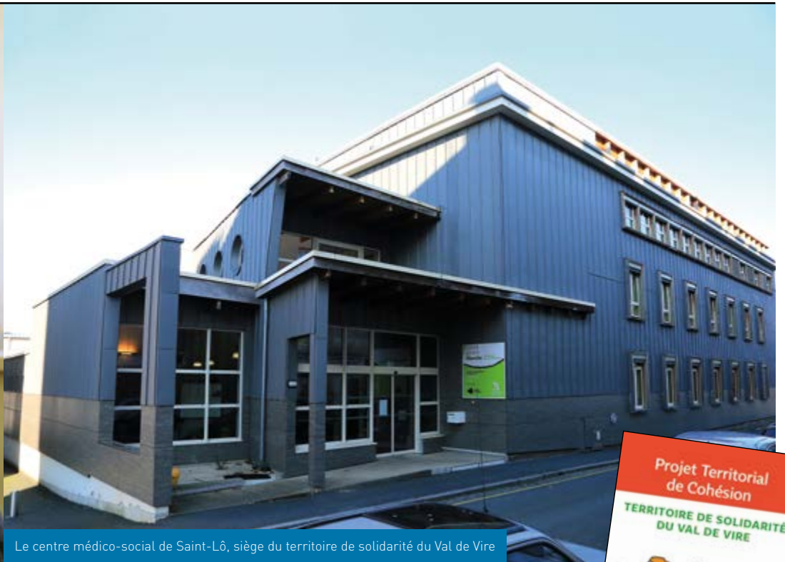
Le centre médico-social de Saint-Lô, siège du territoire de solidarité du Val de Vire