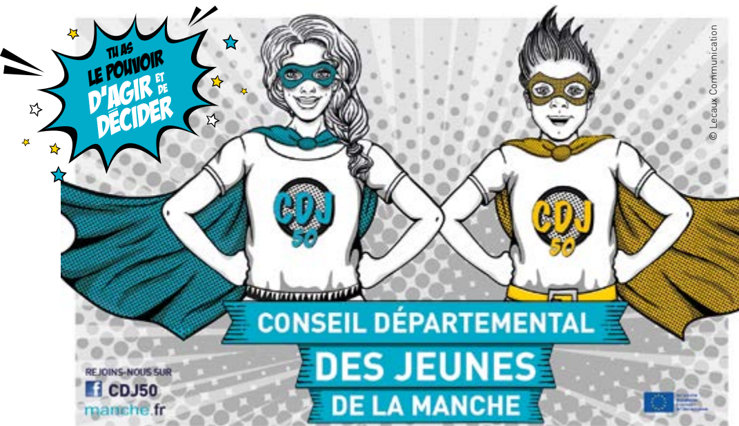
Le visuel de communication destiné aux jeunes.