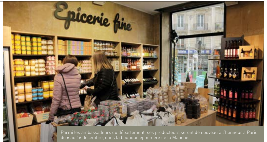
Parmi les ambassadeurs du département, ses producteurs seront de nouveau à l'honneur à Paris, du 6 au 16 décembre, dans la boutique éphémère de la Manche.

► CONTACT : Direction des collèges, de la jeunesse et des sports, Christelle Faggi, référente CDJ : 02 33 05 95 73 - christelle.faggi@manche.fr