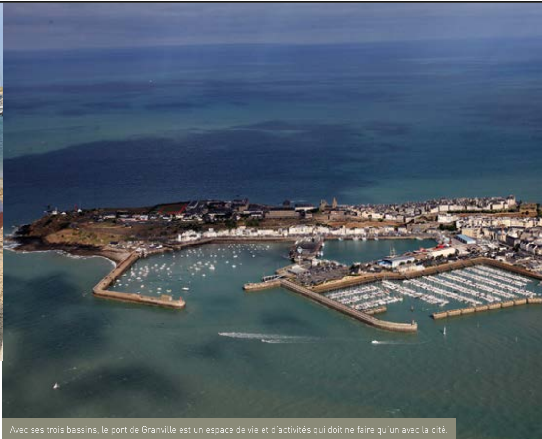
Avec ses trois bassins, le port de Granville est un espace de vie et d'activités qui doit ne faire qu'un avec la cité.