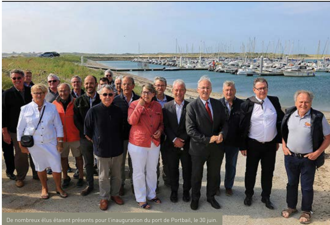
De nombreux élus étaient présents pour l'inauguration du port de Portbail, le 30 juin.