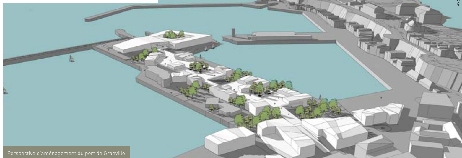
Perspective d'aménagement du port de Granville

Signature du protocole d'accord du Département avec le groupement lauréat de l'appel à manifestation d'intérêt (AMI) le 15 juin 2018 ; aménagement du port de pêche en 2019 et du terre-plein plateau technique en 2020 ; début potentiel des travaux de l'AMI en 2021