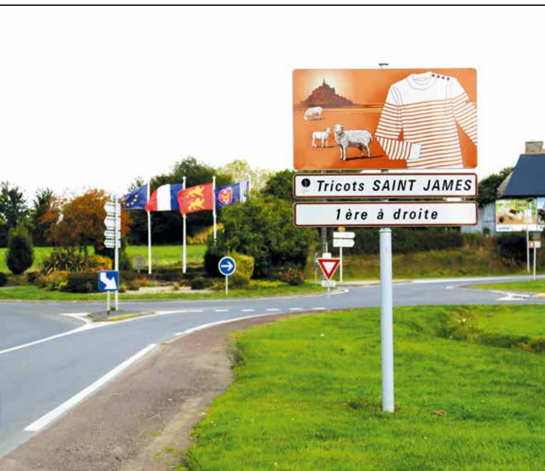
Les principaux panneaux introduits par le schéma directeur de signalisation touristique sont de type H30, comme celui-ci, qui indique une de nos entreprises du patrimoine vivant.