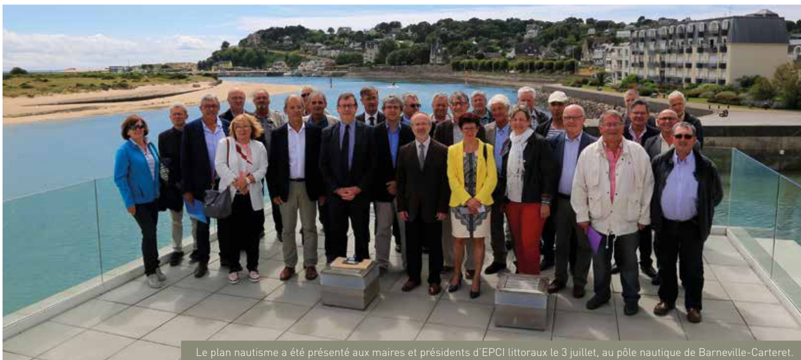
Le plan nautisme a été présenté aux maires et présidents d'EPCI littoraux le 3 juillet, au pôle nautique de Barneville-Carteret.