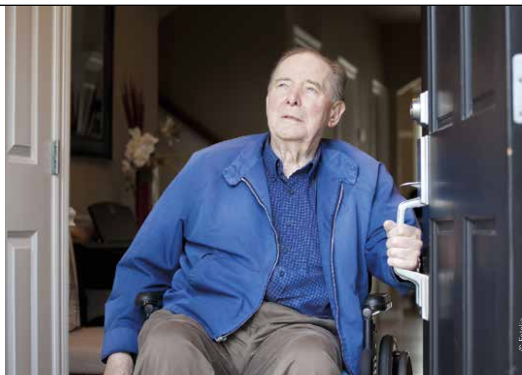
En réadaptant le matériel, Ecoreso Autonomie veut en faire une "facilité de vie" pour les usagers.

Cette mise en place se fera progressivement, à mesure du renouvellement des panneaux existants.